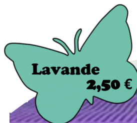
Lavande 2,50 €