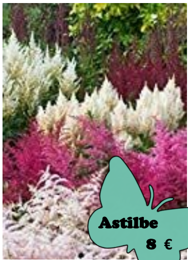
Astilbe 8 €