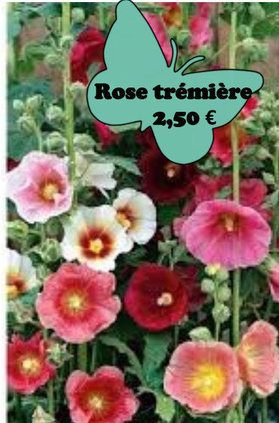
Rose trémière 2,50 €