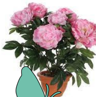
Pivoine 15 €