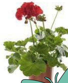
Géranium 2,50 €