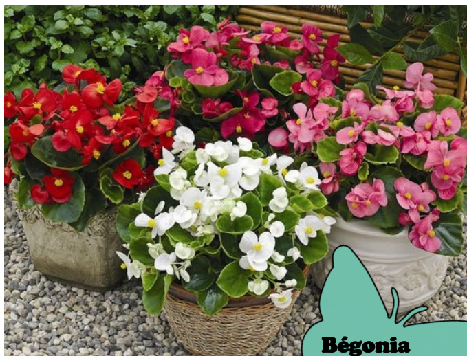
Bégonia 2,50 €