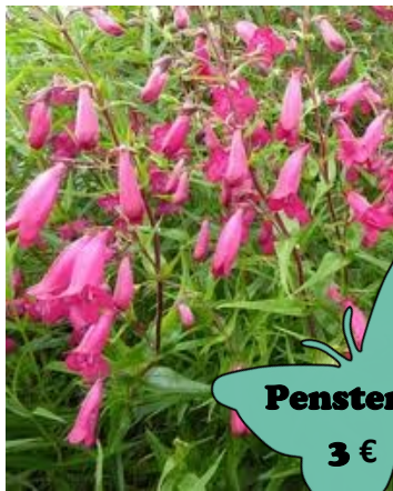
Penstemon 3 €